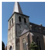
H. H. Marcellinus & Petrus Oud-Geleen Leursstraat

Vrijdag 7 juni 8.30u Aanbidding 9.00u H. Mis T.e.v. het H. Hart van Jezus